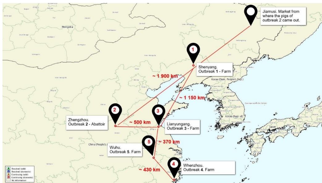
Mapa 2: Focos de PPA declarados en la RPC en 2018 y distancia entre ellos

Por otra parte, y fuera del contexto europeo, el 3 de agosto de 2018 se declaró por primera vez la enfermedad en la República Popular de China , donde se han declarado ya un total de cinco focos separados geográficamente. El primer foco, ocurrió en la provincia de Liaoning, en el norte del país, y afectó a una explotación con 383 cerdos, de los cuales 47 enfermaron y murieron, adoptándose una serie de medidas preventivas enfocadas a controlar la enfermedad. No obstante, se sucedieron otros cuatro focos, ocurridos en las provincias de Henan, Jiangsu, Zhejiang y Anhui, respectivamente. El quinto foco, el más reciente hasta la fecha, afectó a una granja de 459 cerdos, de los cuales 80 murieron y el resto fueron sacrificados. La hipótesis más firme sitúa el origen de la enfermedad en Rusia, de hecho, los cerdos que causaron el segundo foco procedían de un mercado muy cerca de la frontera con este país. Los últimos focos han tenido lugar en provincias orientales y cada vez más el sur, zonas de elevada densidad de ganado porcino.