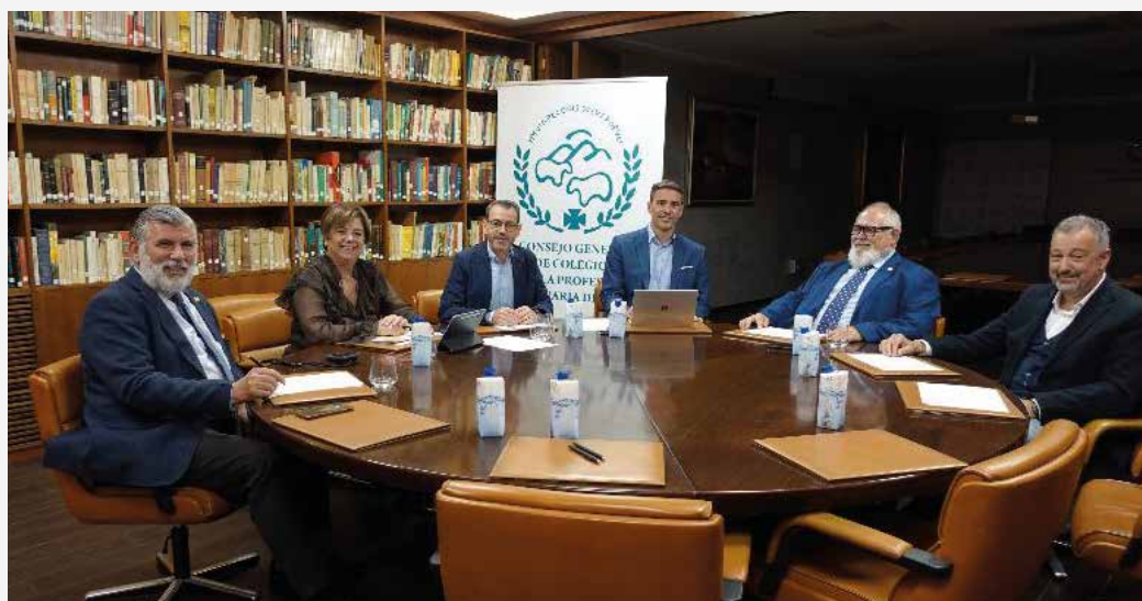
La reunión tuvo lugar en la sede de la OCV con representantes de las dos partes

Por ello, estima prioritario abrir un proceso de diálogo que permita revisar el marco laboral actual, en el que los salarios de los veterinarios se sitúan por debajo de la media