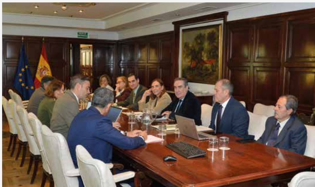
La reunión tuvo lugar en el Ministerio de Agricultura el pasado 11 de diciembre.

En lo que se refiere a la libertad de prescripción, la OCV considera que debe atenderse de manera prioritaria al criterio clínico del veterinario, y, por tanto, cuando concurren circunstancias clínicas no previstas en la autorización de comercialización, y que así lo justifiquen en un paciente, siempre sobre la base del juicio clínico del veterinario y atendiendo a la necesidad de garantizar el bienestar físico del animal, el facultativo pueda ajustar el tratamiento de un medicamento con respecto a lo indicado en su ficha técnica. De ese modo, se podrá garantizar un efecto suficiente y